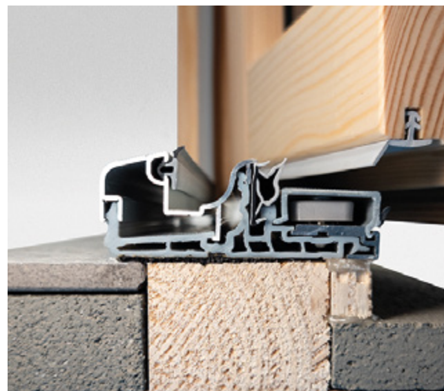
Esempio di applicazione di nastro Roverseal Fast 3 da 50mm su soglia ST570 .