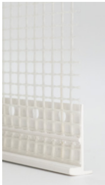
Profilo di finitura 6 mm

Profilo di finitura per cappotto esterno costituito da un bordo parasigolo in PVC con lavorazione a fori circolari e sovraverniciabile con tutte le pitture murali e da una retina porta rasatura per cappotto saldata al bordo.